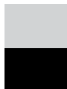
1/2-sida liggande 200 x 132 mm 9.000 kr