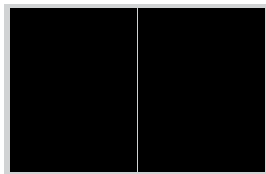
2/1-uppslag (2x) 208x278 mm + 5 mm utfall 25.000 kr