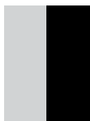
1/2-sida stående 98 x 268 mm 9.000 kr