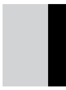
1/4-sida stående spalt 47 x 268 mm 5.000 kr