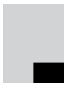
1/8-sida liggande 98 x 64 mm 3.000 kr